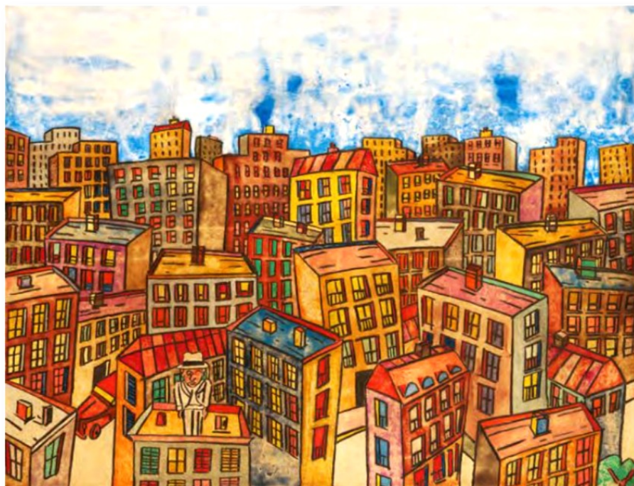
Antonio Seguí, Sentirse solo, 2012.